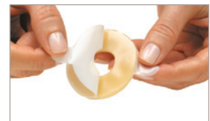
2 Retirez les deux pellicules plastiques