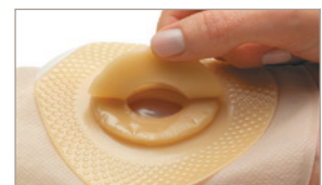
6 Superposez des anneaux pour un meilleur ajustement