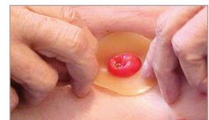
5 Appliquez l'anneau à la peau, en s'assurant qu'il soit ajusté au point de rencontre entre la peau et la stomie