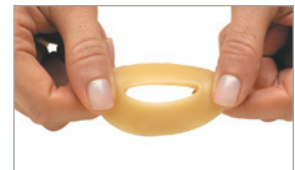
3 Étirez pour mieux ajuster