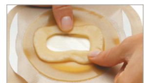
4 Modelez l'anneau pour un ajustement personnalisé